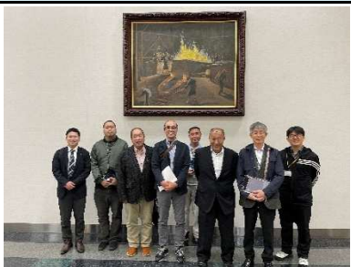
プロテリアル安来工場にて撮影

12月24日(水)に、最先端の生産技術や品質管理の取組について学ぶ視察研修を実施しました。プロテリアル安来工場では1万トン自由鍛造プレス機を使用した航空機材料の製造現場を見学し、三菱マヒンドラ農機では徹底した品質管理や効率化した製造ラインを見学しました。参加者同士が現場での課題や工夫について意見交換をおこない、分野を越えて情報や視点を共有できたことで新しい気づきに繋がる大変有意義な機会となりました。